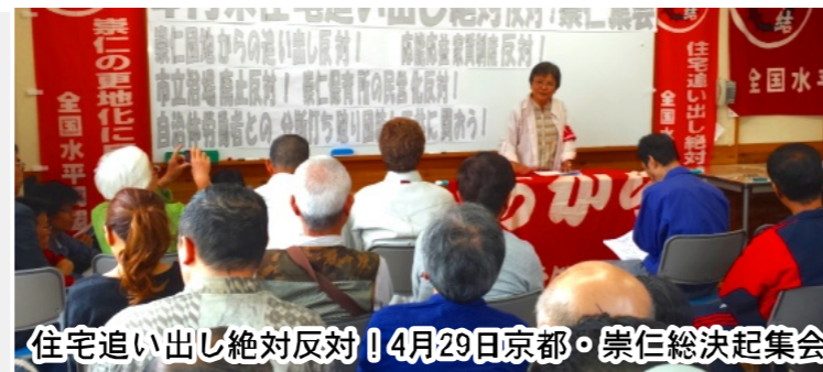
住宅追い出し絶対反対 4月29日京都・崇仁総決起集会

何でも話し合います。長時間労働・首切り、仕事で困っている。団地の階段の上り下りがたいへん、1階に移りたい。不当な家賃請求された。何でも話し合い、団結して生きていきましょう。 高槻・京都に団結拡大 一年前、8家族は、300人の警察を動員した国・八尾市の住宅追い出し仮執行(強制執行)との闘いに、団結を守り勝利しました。 この闘いは、高槻市富田に、さらに京都・崇仁、東三条に拡大し、全国水平同盟高槻支部の結成、崇仁支部準備会の結成へ団結を拡大しています。 仮執行取消判決隠した住管 この闘いに追いつめられた八尾市は、八尾市議会への報告において、高裁の「仮執行