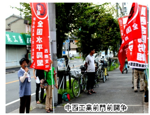
中西工業前門前闘争

労働相談やっています。非正規、低賃金、長時間労働、パワハラ、過労死、首切り、... 一人で悩まず、相談に来て下さい。 こんな現実を変えられる! 労働組合に入って闘おう。