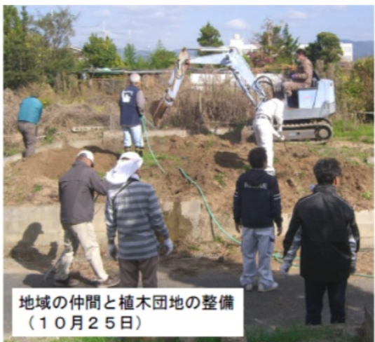
地域の仲間と植木団地の整備 (10月25日)

私たちは、今、ゼネストをめざした自主管理闘争という新しい闘いに踏み出しています。自主管理闘争は、労働組合の団結と管理のもとに、全国の労働者・労働組合の支援を得て、「植木団地追い出し」職場を奪う全員解雇の攻撃に負けず、植木団地を根城に、明