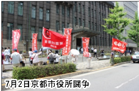
7月2日京都市役所闘争