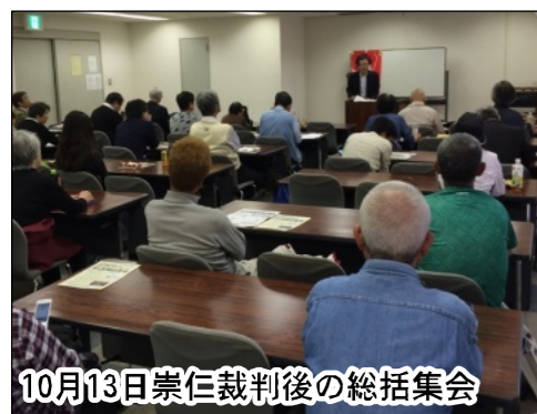
10月13日崇仁裁判後の総括集会

権を奪い、労働者を叩き出すやり方には絶対反対です。自治体労働者をはじめ労働者と団結して闘えば、展望は開けてきます。11月労働者集会に結集している労働者と熱く連帯して、新自由主義攻撃であ