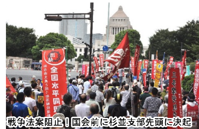
戦争法案阻止！国会前に杉並支部先頭に決起

高槻植木 到来です。 る時代の と決起す れば続々 明に立て と旗を鮮 いの路線 我々が闘 ています。 が進行し 生活破壊 さまじい 解雇・首切り、住宅追いだしを始め