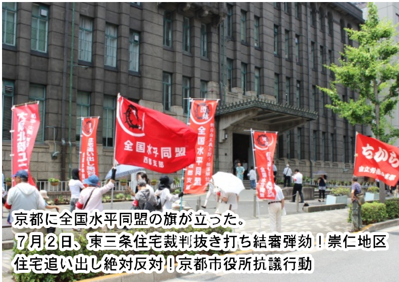
京都に全国水平同盟の旗が立った。 7月2日、東三条住宅裁判抜き打ち結審弾劾！崇仁地区 住宅追い出し絶対反対！京都市役所抗議行動