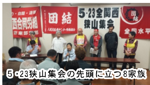
5・23狭山集会の先頭に立つ8家族