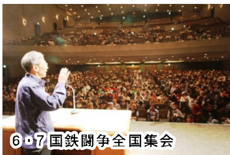
6・7国鉄闘争全国集会