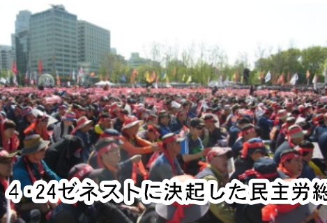
4・24ゼネストに決起した民主労総

とられた辺野古新基地建設反 対沖縄県民大会は、労働組合 の闘いを軸に全島ゼネストへ と発展しようとしています。 大阪では、現場労働者の絶 対反対の闘いが、労働者の怒 りとつながり、「大阪都構想」 ＝維新・橋下を打倒しました。 西郡支部はその攻防の最先端 で闘いぬきました。