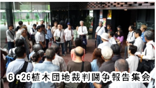
6・26植木団地裁判闘争報告集会

国・資本の階級分断・団結破 壊の攻撃に屈服し、「部落民 は労働者ではない」と言って、 部落解放闘争を労働者の闘い から引き離し、「差別に対す る国の補償」を求める運動に 歪めてきました。今や新自由 主義の「人の命よりも金儲け」 の手先となり、ムラの団結を 破壊し民営化・更地化の受け 皿に成り下がっています。