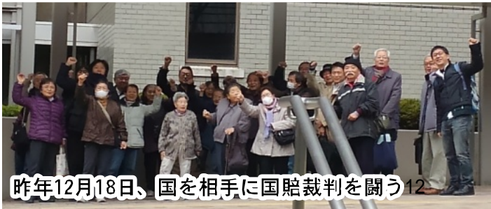
昨年12月18日、国を相手に国賠裁判を闘う12

福島の子どもの命を守ろう！被ばく労働拒否！すべての原発いまずくなくそう！を呼びかけ、昨年6月20日、NAZEN八尾を結成