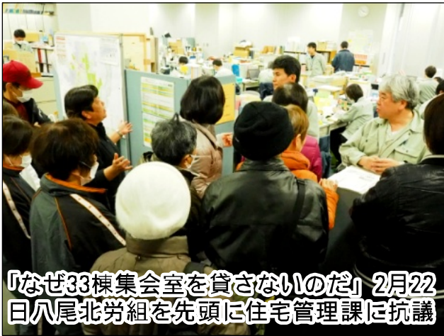
「なぜ33棟集会室を貸さないのだ」2月22日八尾北労組を先頭に住宅管理課に抗議