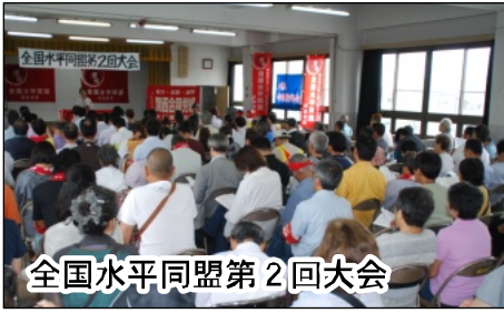
全国水平同盟第2回大会