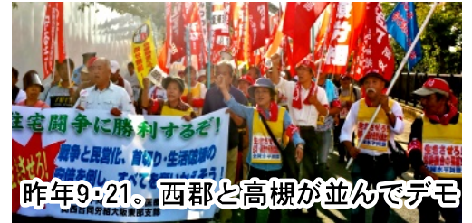
昨年9・21、西郡と高槻が並んでデモ

この闘いの中で団結を広げ、高槻市による植木団地追い出しと真つ向から闘っていた高槻市富田園芸協同組合の仲間が合流し、9月21日西郡で闘われた住宅闘争勝利・全国集会を共に闘いました。そして